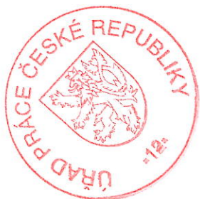
Mgr. et Mgr. Jacek Morávek zástupce vedoucí oddělení agentur práce

Podle ust. § 81 odst. 1 správního řádu, lze proti tomuto rozhodnutí podat odvolání k Ministerstvu práce a sociálních věcí, prostřednictvím Úřadu práce, u něhož se odvolání podává. Podle ust. § 83 odst. 1 správního řádu činí lhůta pro podání odvolání 15 dnů. Lhůta pro podání odvolání běží ode dne následujícího po doručení písemného vyhotovení rozhodnutí, nejpozději však po uplynutí desátého dne ode dne, kdy bylo nedoručené a uložené rozhodnutí připraveno k vyzvednutí.